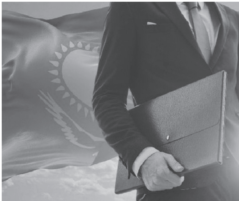
Мемлекеттік қызметшінің этикасын сақтау мәселелері бойынша мына мекен-жайға хабарласуға болады: Сәтбаев қаласы, Сәтбаев қаласы, 108, сенім телефоны: 37575.

7. Мемлекеттік органның басшылығына мемлекеттік органдардың